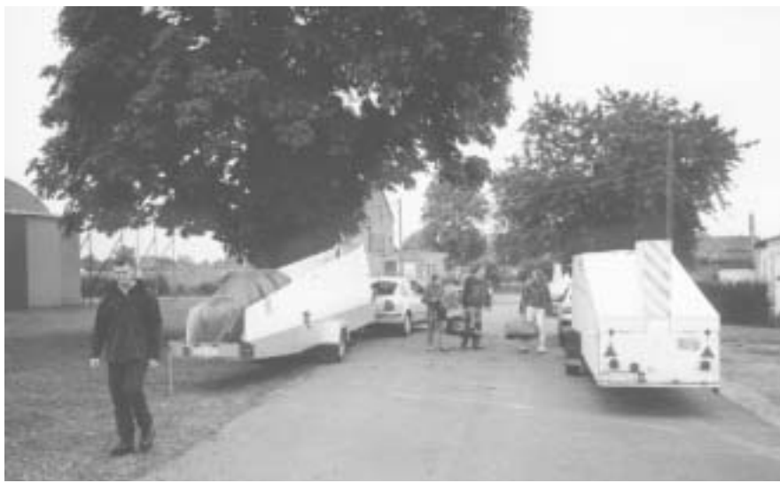
Klaar om te vertrekken

nog net binnen het academisch kwartiertje. We zullen Theo eens bewijzen dat we op tijd kunnen vertrekken.